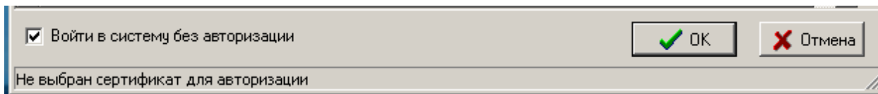
Рисунок 1- Авторизация пользователя

2) После этого поставьте «галочку» в поле «Войти в систему без авторизации» (см. Рис. 1) и нажмите «ОК»,